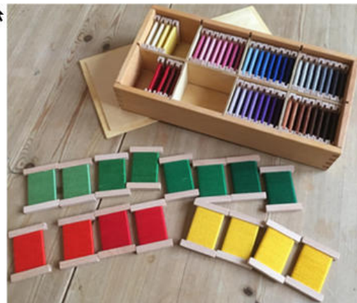
Farbtäfelchen 32 Farbpaare