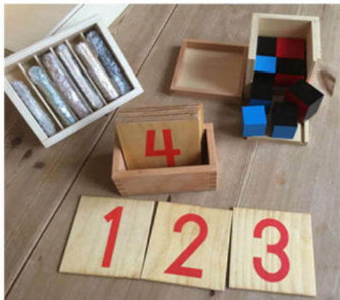
Zahlentäfelchen mit Kistchen & binomischer Würfel