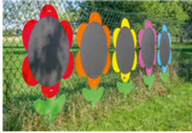
5 Blumen-Tafeln & Tafelkreide