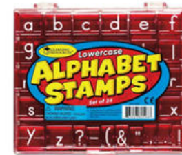
Alphabet-Stempel Groß- und Kleinbuchstaben