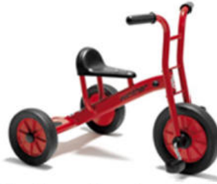
Winther Dreirad Viking