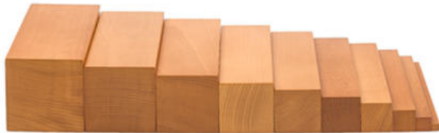
2 x Braune Treppe